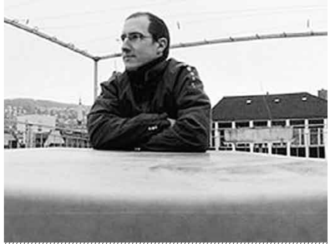
The Rabbit Theory