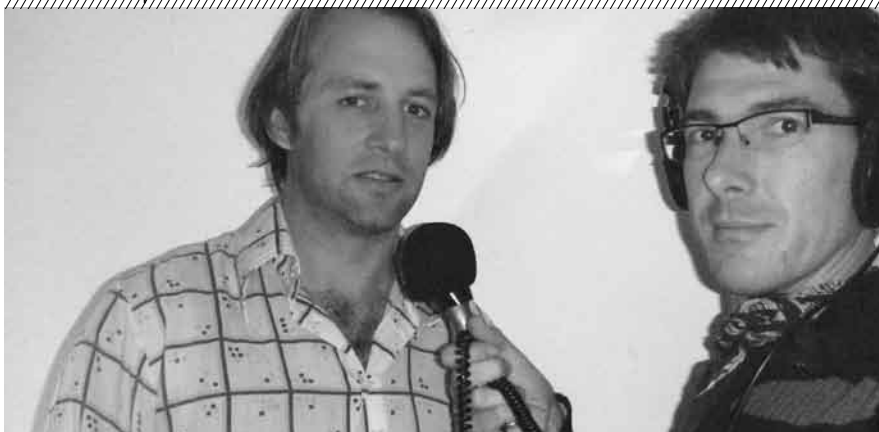
Radio Avanti Papi