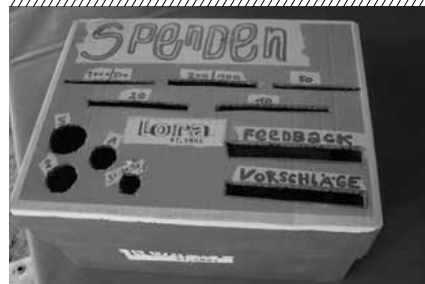
Auch Feedback ist willkommen!