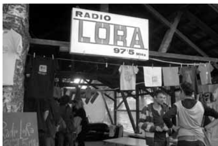
1. Mai LoRa auf dem Kasamenareal

Titel LoRa-T-Shirt-Motiv von www.comet substance.com