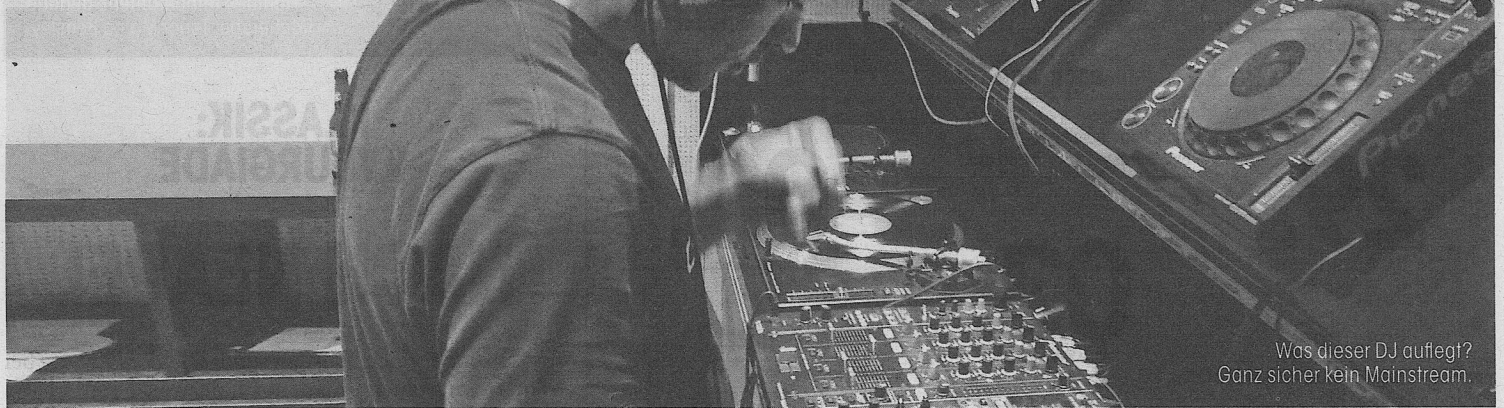
Was dieser DJ auflegt? Ganz sicher kein Mainstream.